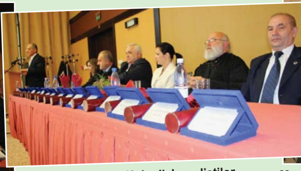
Senatul Uniunii Jurnaliștilor din Banatul Istoric